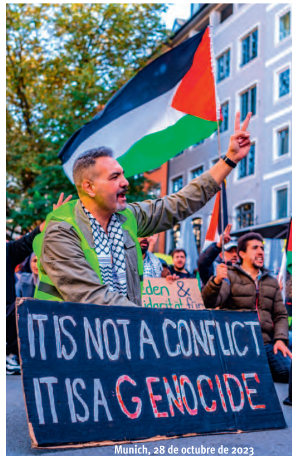
Munich, 28 de octubre de 2023

Extracto traducido y abreviado del podcast “Anti-Semitism = Anti-Jesus”, oneforisrael.org - publicado con amable autorización.