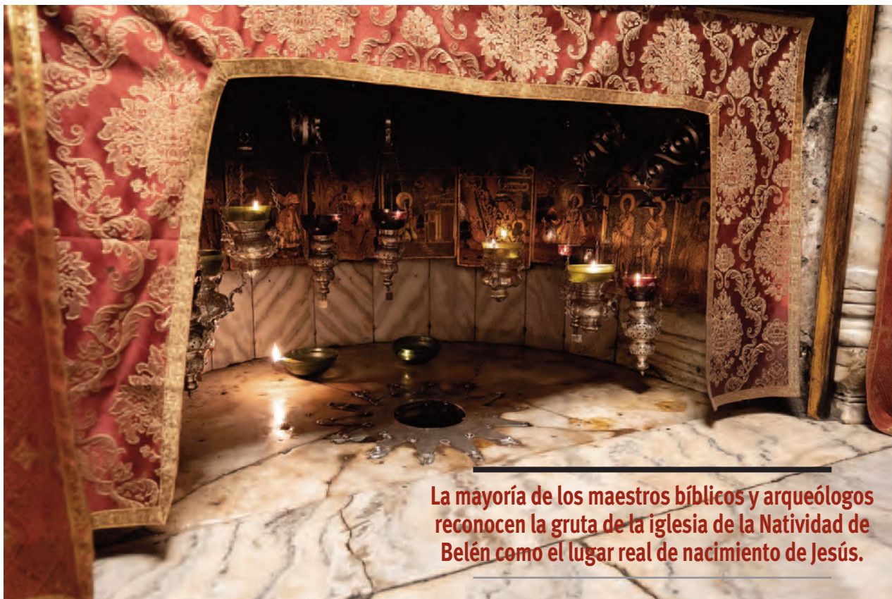
La mayoría de los maestros bíblicos y arqueólogos reconocen la gruta de la iglesia de la Natividad de Belén como el lugar real de nacimiento de Jesús.

palabras, no había un lugar apartado para que María diera a luz en esta abarrotada habitación de huéspedes. Por tanto, tuvo que abrirse paso, y la única habitación que no estaba ocupada y en la que tenía cierta intimidad era el sótano de la casa. En Belén, se trataba de cuevas o grutas integradas en la casa que servían para guardar provisiones y animales. Por cierto, Justino, el mártir, que vivió en el siglo II d.C., también confirma que de hecho Jesús nació en una cueva o gruta (Diálogo con Trifón, 78). Por ello, la mayoría de los maestros bíblicos y arqueólogos reconocen la gruta de la iglesia de la Natividad de Belén como el lugar real de nacimiento de Jesús.