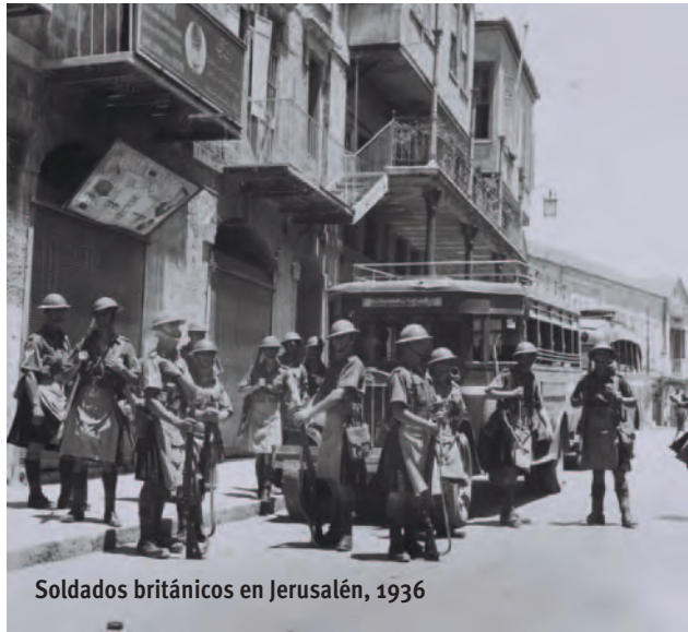
Soldados británicos en Jerusalén, 1936

El primer ataque de los ejércitos árabes contra Israel tuvo lugar la misma noche de su fundación. Israel ganó la guerra y todas las siguientes, incluida la Guerra de los Seis Días: en 1967, las tropas árabes marcharon contra Israel en todos los frentes, anunciando una campaña de destrucción y la completa aniquilación de la nación. Las fuerzas de protección de la ONU huyeron para ponerse a salvo. En su angustia, Israel se atrevió a dar un golpe de liberación, ganó la guerra y conquistó los Altos del Golán, la península del Sinaí, la Franja de Gaza, “Cisjordania” y Jerusalén del Este.